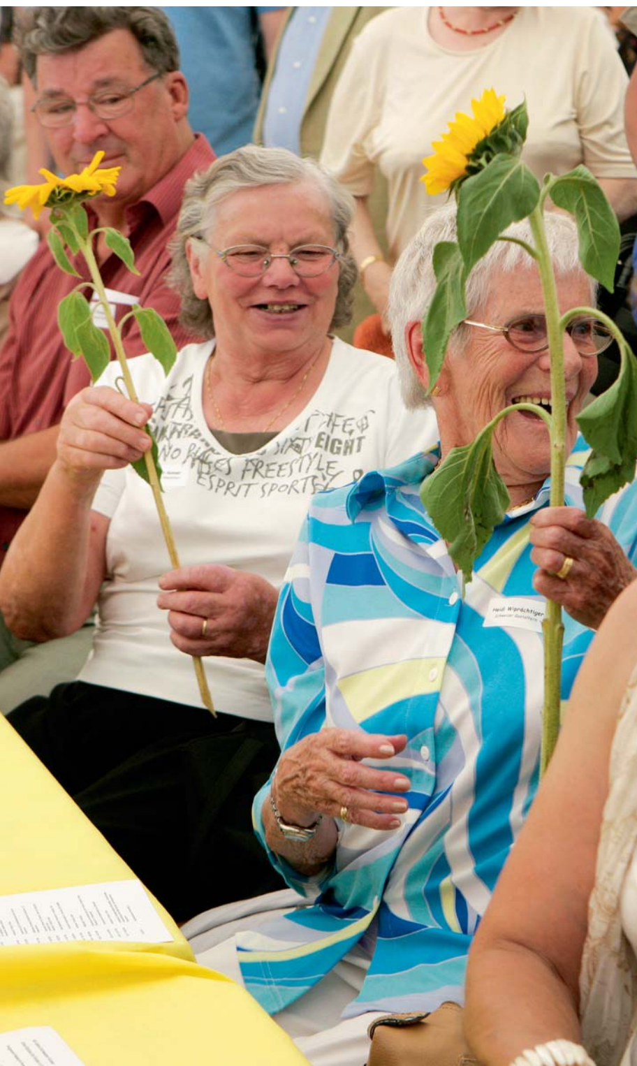
Gerührt: Die Freude über die Sonnenblumen ist den Schweizer Gastmüttern während des gesamten Festaktes ins Gesicht geschrieben.