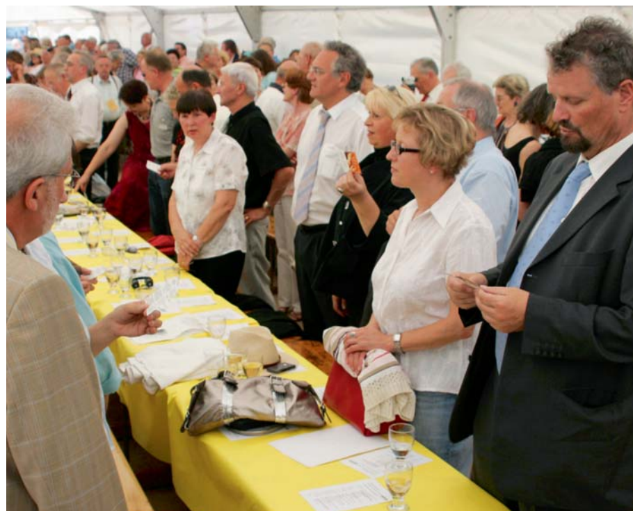
Ergriffen: Beim Thurgauer Lied stehen die Schweizer und ihre Gäste auf. Rechts Gernot Eler, Mitglied des Bundestags und Staatsminister im Auswärtigen Amt (D).